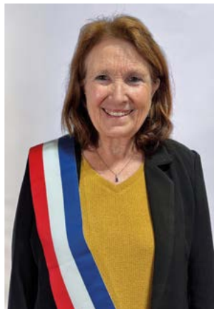
Déléguée à l'éducation et la jeunesse