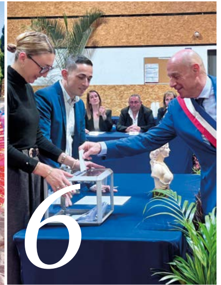
6 ÉLECTIONS MUNICIPALES