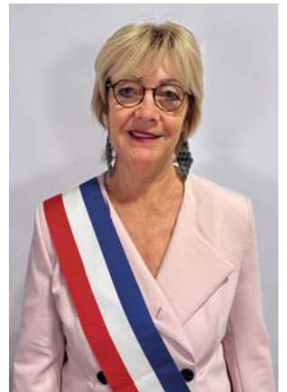
Déléguée à la culture