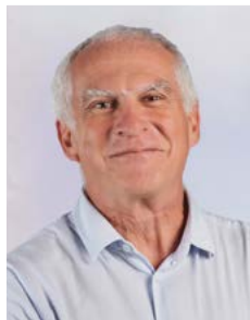
Délégué administration générale, RH, population