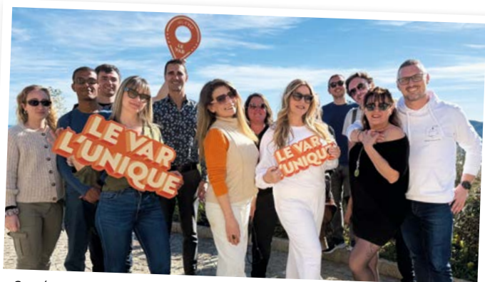
8 créateurs de contenu totalisant plus d'un million de followers !