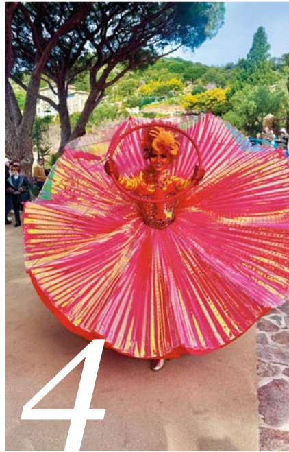
4 RETOUR SUR LE CORSO