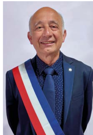
Délégué à la vie associative, événementiel, sports