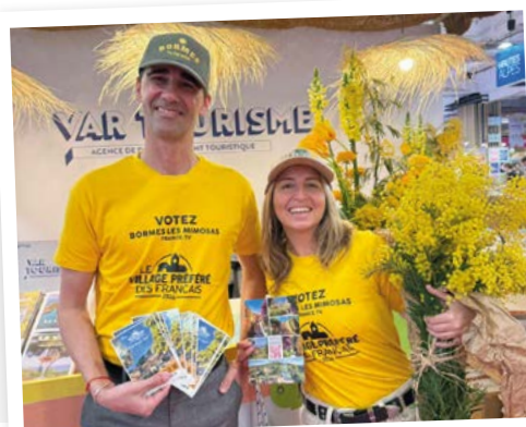
Des allées du Salon de l'agriculture aux plateaux télé, les équipes borméennes au taquet !