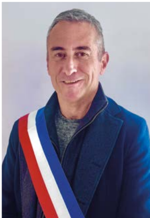
1 er adjoint, délégué aux travaux et service technique