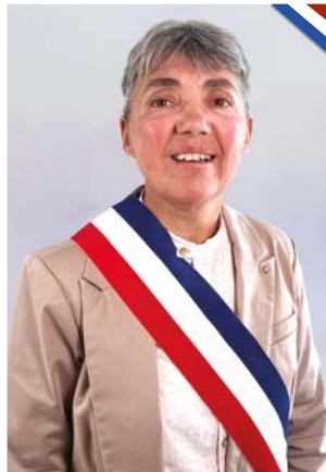
Déléguée à la vie sociale, petite enfance, CCAS