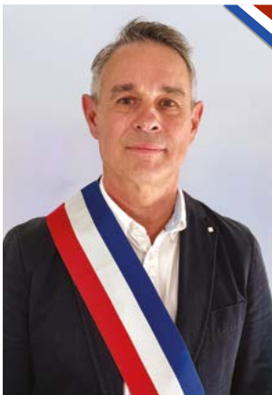
Délégué à la sécurité