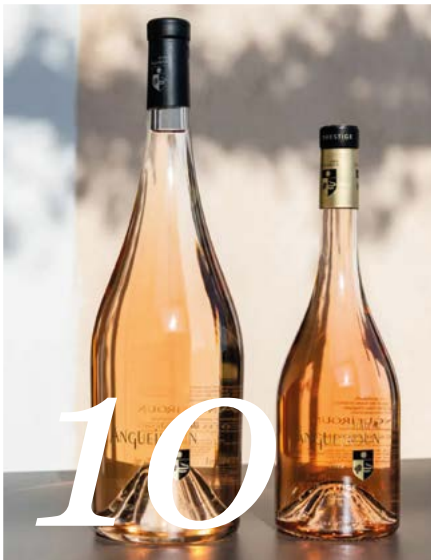
10 NOS BORMÉENS ONT DU TALENT