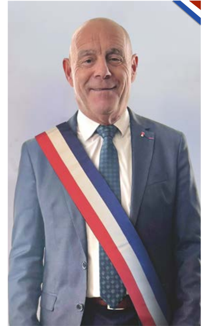
Maire et Vice-président de l'intercommunalité Méditerranée Porte des Maures

Découvrez les visages qui s'engagent au quotidien à votre service.