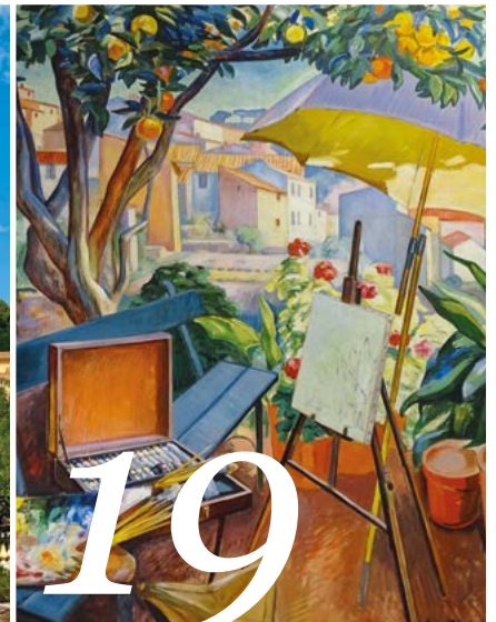
19 100 ANS DU MHAB