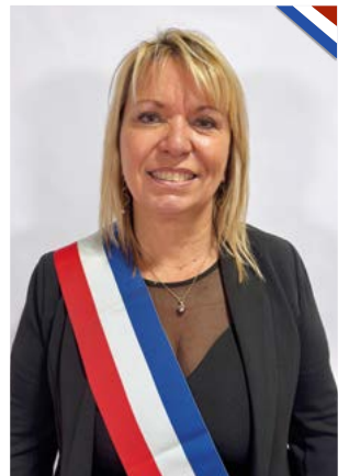
Déléguée au tourisme