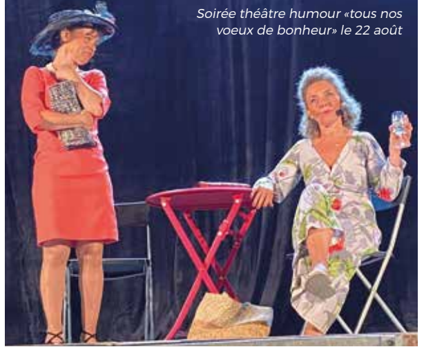
Soirée théâtre humour «tous nos vœux de bonheur» le 22 août