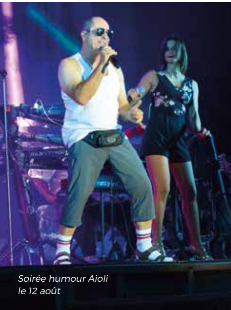
Soirée humour Aioli le 12 août