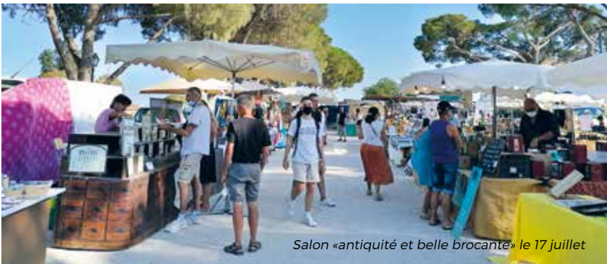
Salon «antiquité et belle brocante» le 17 juillet