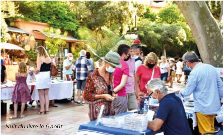
Nuit du livre le 6 août