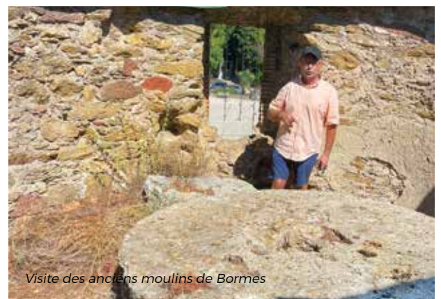
Visite des anciens moulins de Bormes