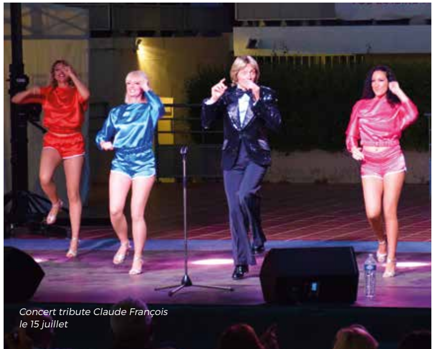
Concert tribute Claude François le 15 juillet

Concerts, shows hommage, soirées humour, théâtre, feu d'artifice,... Une programmation ambitieuse pour répondre au besoin d'évasion des Borméens et vacanciers dans le respect des consignes sanitaires. Service événementiel, police municipale, sécurité civile communale, service communication,... au fil de l'été, les équipes municipales ont dû continuellement se réinventer et s'adapter afin d'assurer un large choix d'animations gratuites et leur promotion.