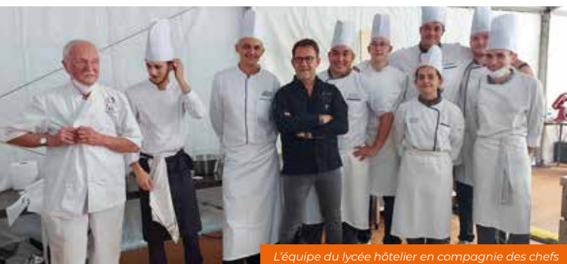
L'équipe du lycée hôtelier en compagnie des chefs