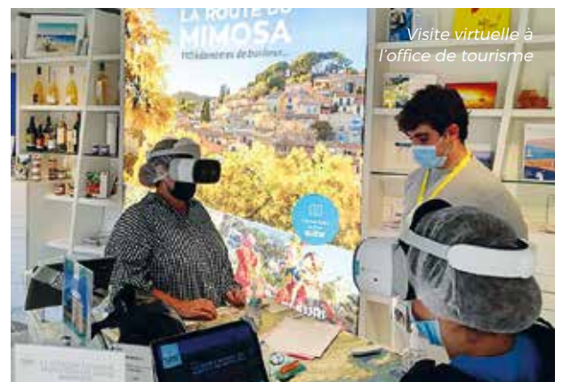
Visite virtuelle à l'office de tourisme