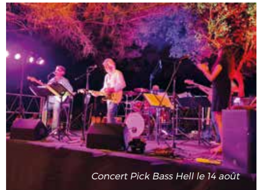
Concert Pick Bass Hell le 14 août