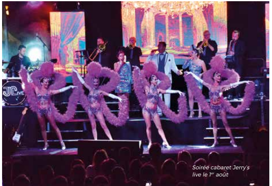
Soirée cabaret Jerry's live le 1 er août