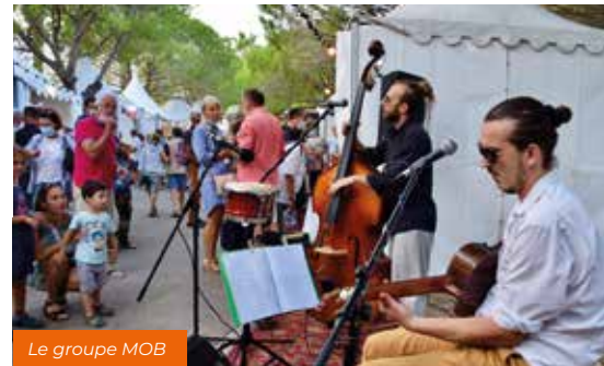
Le groupe MOB