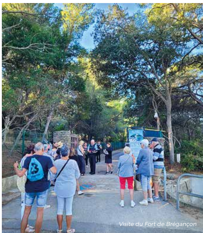
Visite du Fort de Brégançon