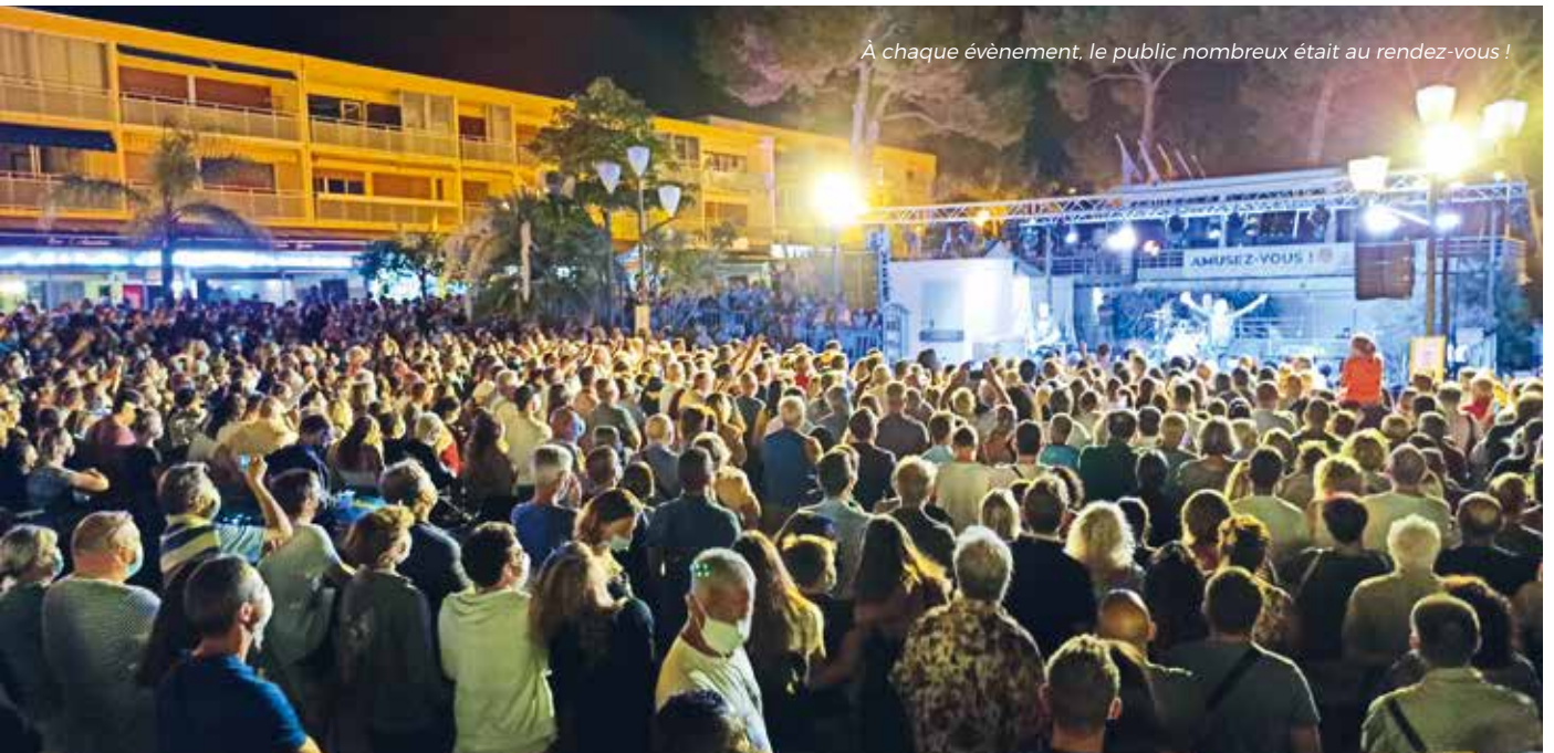
À chaque évènement, le public nombreux était au rendez-vous !