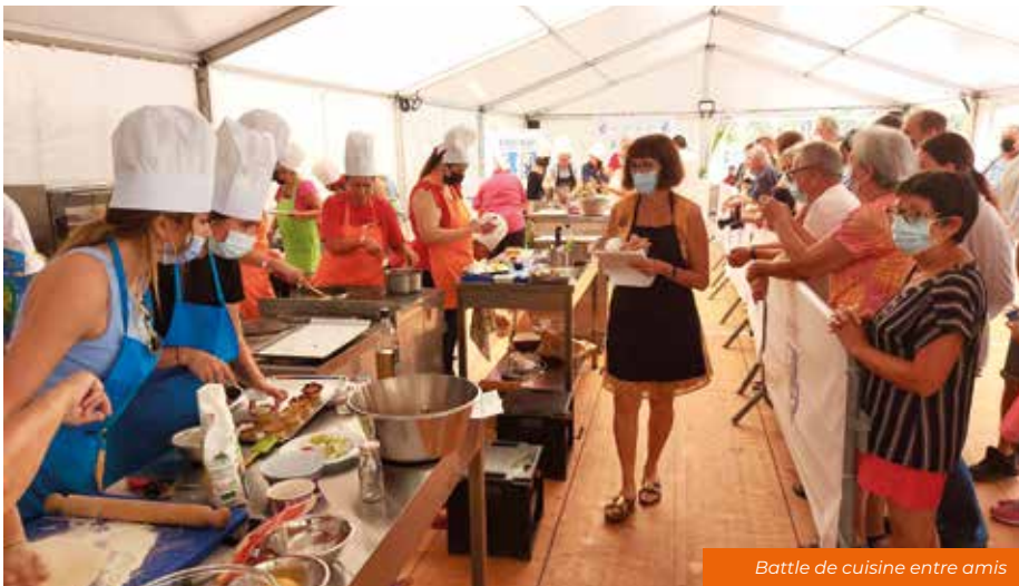
Battle de cuisine entre amis