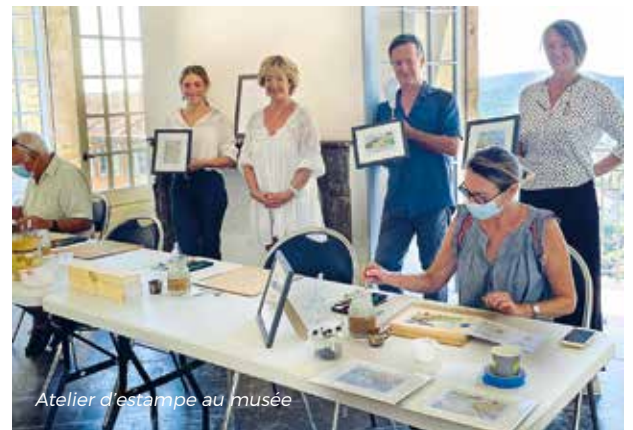
Atelier d'estampe au musée